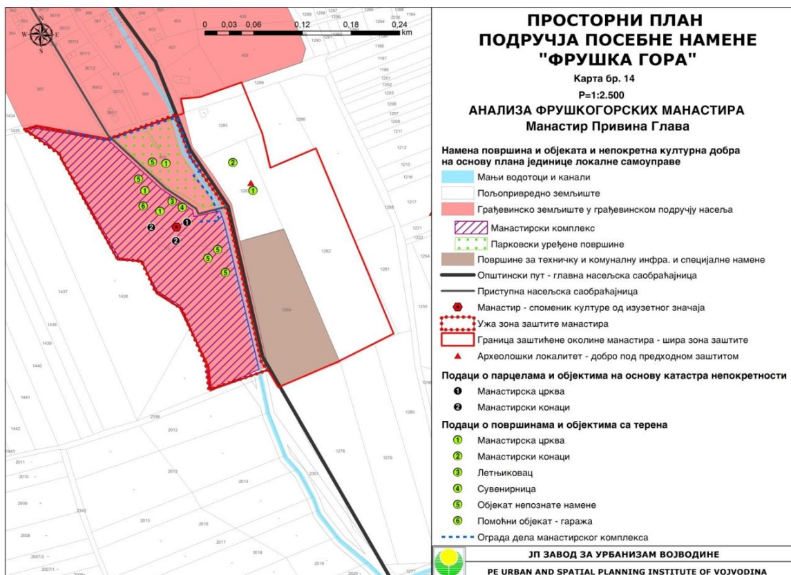
Karta br. 3: Analiza manastira Privina Glava