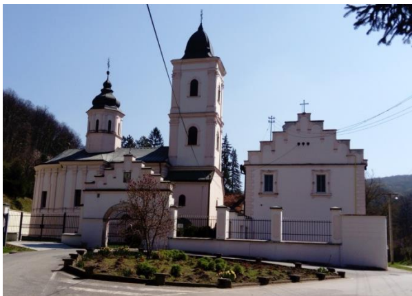
Slika 1: Manastir Beočin

U toku izrade Prostornog plana, utvrdiće se stanje postojeće izgrađenosti i uređenosti manastirskih kompleksa sa njihovim neposrednim okruženjem, s obzirom na to da su se poslednjih godina dešavale brojne promene koje se odnose na izgradnju objekata. Potrebno je analizirati potrebe koje iskazuju manastirske zajednice kao neophodne da bi se obezbedili uslovi i stvorio ambijent za njihovo zadovoljavanje i poboljšanje kvaliteta života, kao i da bi se obezbedio održivi razvoj pojedinačnog nepokretnog kulturnog dobra. Na osnovu utvrđenog činjeničnog stanja i analize iskazanih potreba stekli bi se uslovi za određivanje planskih mera za dalje uređenje, zaštitu i prezentaciju manastira i njihove zaštitne zone. U tom procesu, neophodno je usaglasiti podatke i uslove nadležnih zavoda za zaštitu spomenika kulture sa Pokrajinskim zavodom za zaštitu prirode, Srpskom pravoslavnom crkvom i upravljačem Nacionalnog parka, JP „Nacionalni park Fruška gora“, Sremska Kamenica kao ostalim učesnicima i korisnicima na ovom prostoru.