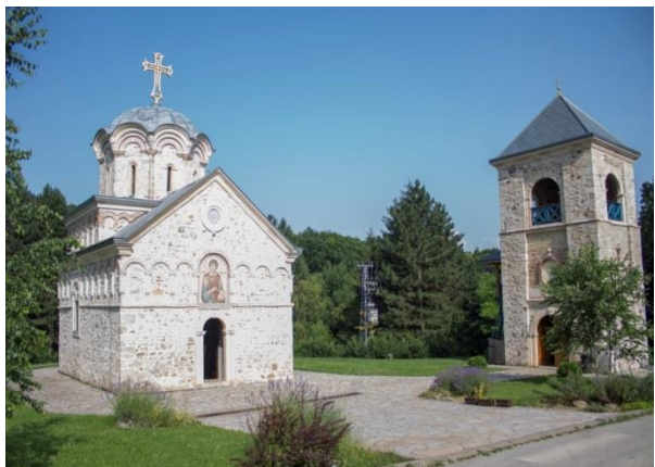
Slika 2: Manastir Staro Hopovo

Elaborat sadrži detaljan opis postojećeg stanja, uočena ograničenja, potencijale i iskazane zahteve manastirskih zajednica koji mogu biti od uticaja na posmatrano područje, a isti je urađen na osnovu podataka prikupljenih sa terena, podataka i dokumentacije pristigle od strane manastira, kao i podataka iz stručne literature i s internet sajtova.